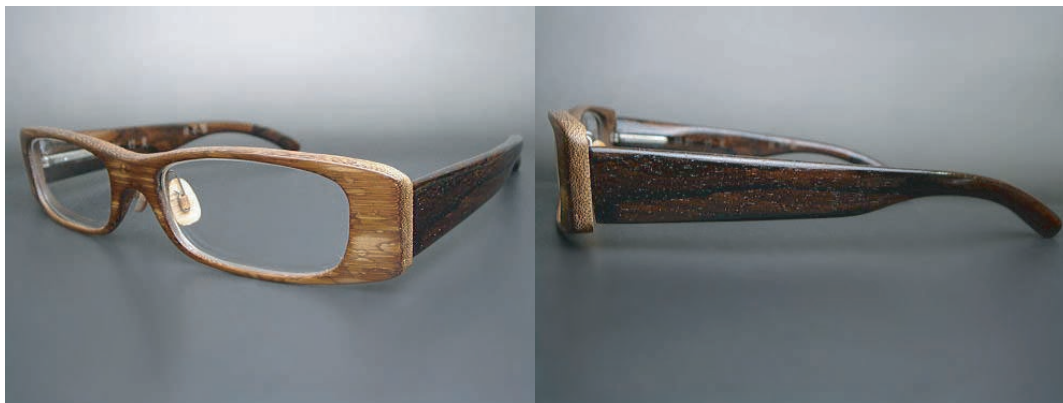
品番 : K0-713F SIZE : 53□20-142 (28.4) ※ F : 図面竹 (ス・メンチ)