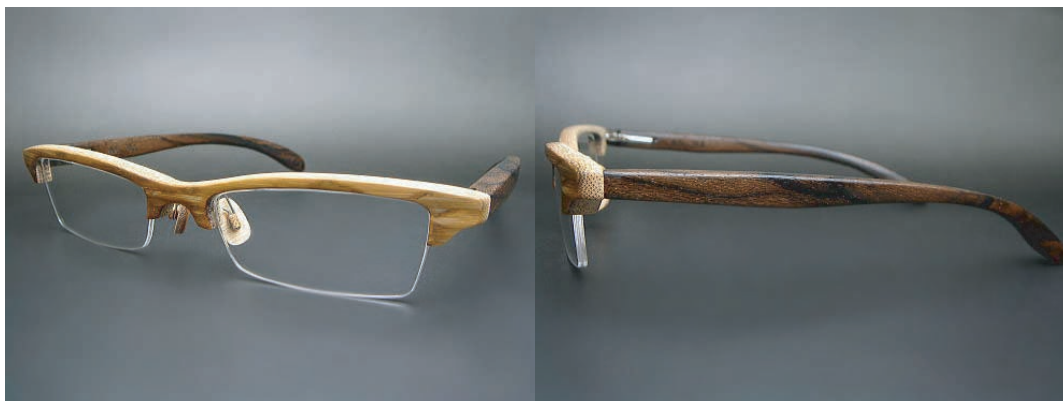
品番 : K0-709H SIZE : 51□20-145 (25.8) ※ F : 図面竹 (ス・メンチ)