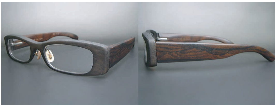
品番 : K0-711F SIZE : 52□20-143 (27.7) ※ F : 図面竹 (ス・メンチ)・染色